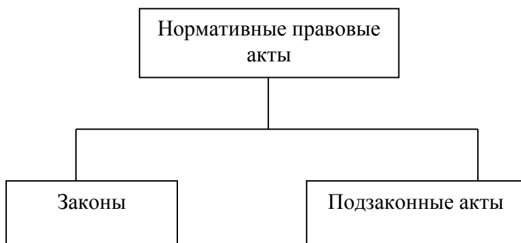
Рисунок 2 – Виды нормативных правовых актов 1

Если рисунок является авторской разработкой, необходимо после заголовка рисунка поставить знак сноски и указать в форме подстрочной сноски внизу страницы, на основании каких источников он составлен, например: